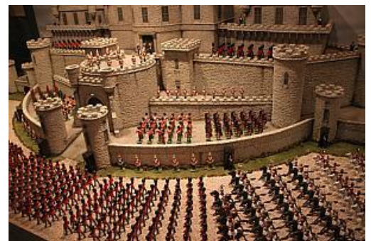
袖珍博物館(右・真中・左)